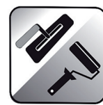
APPLIKATION MIT KELLE/ROLLE